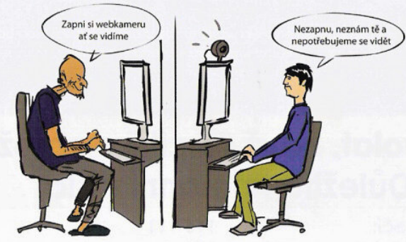
SPRÁVNĚ! ✅ Proč Petr odmítnul webkameru zapnout?