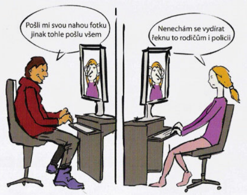
SPRÁVNĚ! ✅ Proč je správné si nic nenechávat pro sebe?